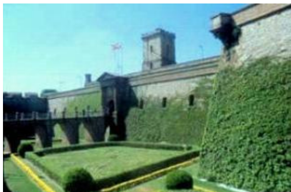
Murallas del castillo de Montjuic (Barcelona)

Convocatoria del IRMU de 15 becas para estudios sobre la Guerra de Independencia