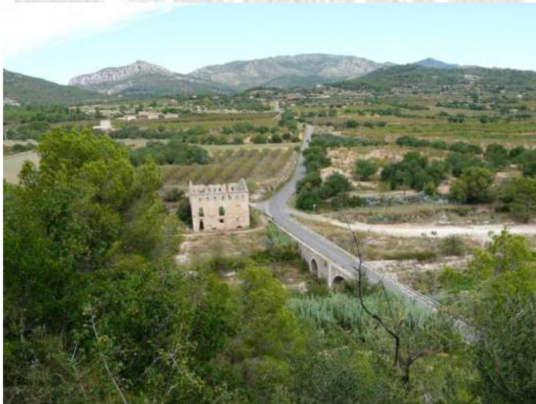
El puente de Goi; en primer plano, las ruinas del molino paplero construido en el siglo XIX

La noche del 24 al 25 de febrero de 1809, el ejército español dejaba atrás Montblanc y surgía del estrecho paso de la Riba, tras llevar más de 10 horas de dura caminata, en plena noche gélida invernal. Reding había ordenado que la marcha se realizase en absoluto silencio, y los soldados de avanzada cruzaron el río Francolí por el puente de Goi, a un par de kilómetros al noroeste de Valls. Hacia las cinco de la madrugada las unidades de vanguardia, mandadas por el general Castro , y buena parte del centro, a las órdenes del general Martí , habían cruzado el puente y dejaban a su izquierda los altozanos del camino de Picamoixons a Valls[15]. Pero mientras las fuerzas españolas seguían cruzando el río, la guardia nocturna francesa les descubrió y abrió fuego[16]. Perdido el elemento sorpresa, las unidades españolas respondieron al fuego de los centinelas franceses, que se retiraron a su campamento, situado a las afueras de Valls, cerca de la otra ribera del río.