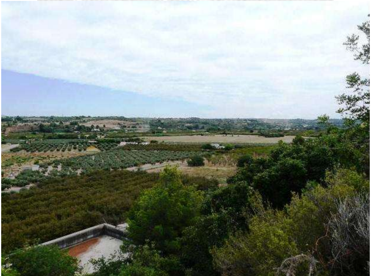
Terrenos actuales de cultivo en el Puente de Goi, donde se libró la batalla

Poco queda del paraje que fue escenario de aquella cruenta batalla: los márgenes del río Francolí se han transformado en los últimos 150 años, gracias a la construcción de una acequia que ha permitido el cultivo de las tierras. La acción del hombre ha transformado el paisaje: donde antes había unas pronunciadas cotas, con márgenes de piedra, con los algarrobos por único cultivo, ahora hallamos una extensa planicie, sembrada de avellanados y limoneros, y donde las casitas emergen de entre los ramales de los árboles; todo nos recuerda cómo el hombre cambia la fisonomía de la tierra a su gusto. La carretera que va de Valls a Picamoixons nos permite gozar de una vista extensa del campo de batalla, desde el punt de vista de los franceses: se puede observar cómo, tras el puente de Goi, se halla el llano que se extiende hasta los alrededores de Tarragona. El punto de observación del despliegue español, obtiene sus mejores vistas desde la urbanización Serradalt , que nace en el mismo puente de Goi: allí contemplamos la sierra que va hasta Picamoixons , la Riba y Alcover, al oeste, y el campanario de la iglesia de Valls, el meandro del Francolí y el llano del Morell hacia Tarragona, al sur.