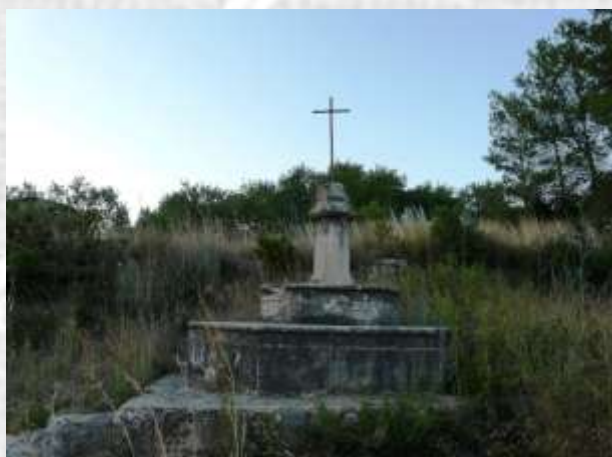
Monumento de 1909, al pie del Puente de Goi, dedicado a los caídos en la batalla.

En la actualidad, justo al pie del puente de Goi, hallamos un pequeño monumento erigido en el año 1909 por los ciudadanos de Valls, en recuerdo del primer centenario de la batalla: se trata de una cruz de hierro –que ni tan solo se conserva, y ha sido substituida por dos hierros mal forjados-, con una base pétrea en la cual tan solo se puede leer, en catalán “ Als màrtirs de la pàtria, caiguts a la batalla de 1809.... ” / [ “A los mártires de la patria, caídos en la batalla de 1809...” ].