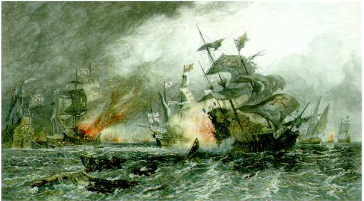
Estampa coloreada por D. Law, basada en O.W.Brierly (Londres, 1882), que reproduce el ataque de los brulots ingleses contra parte de la Armada Invencible en Gravelinas, el 8 de agosto de 1588.

venecians damunt d'aquestes una de llurs naus a la qual havien calat foc y que estava convertida en una gran foguera " ["Por haber lanzado los venecianos encima de estas una de sus naves a la cual habían pegado fuego y que estaba convertida en una gran hoguera"] [3] .