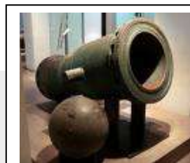
Bombarda corta, con proyectil de hierro al lado <es.wikipedia.org/wiki>

A pesar de la escasa efectividad de esta primera artillería, limitada por un calibre reducido y su transporte problemático, uno de los principales expertos en el arte militar de su tiempo como era Hug Roger III de Pallars , durante la guerra en su condado (1484-1487), sentenciaba: “ les bombardes e passadors guanyen les batalles ” [/ “ Las bombardas y fijadores ganan las batallas ”][19].