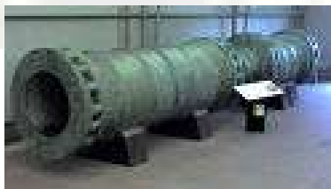
Masterbombarda turca (Estambul).

El 1410 el infante Fernando de Castilla se cubrió de gloria en la toma de Antequera (gesta que le proporcionaría el alias con el que fue conocido). Para ello, tuvo que emplear artillería gruesa. Una bombardarda en concreto, era de tales dimensiones que para moverla se necesitaban 20 parejas de bueyes y 200 hombres de servicio. En junio de 1642, en el asedio de Limerick, los irlandeses capturaron una pieza de artillería de peso 8.000 libras que precisaba de 25 bueyes para moverse, disparando proyectiles de 15 kilogramos [8].