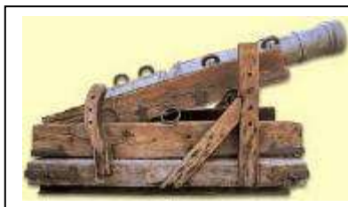
Bombarda montada en cureña y unida con correajes

De su hijo Alfonso IV , solo diremos que son numerosísimas las noticias documentales sobre artillería de pólvora vinculadas a sus campañas militares transmediterráneas[18].