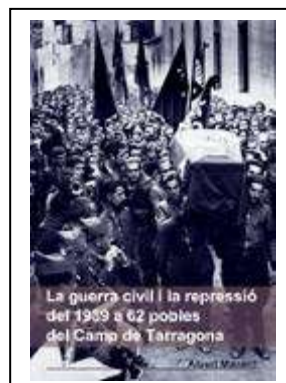
La Guerra Civil Española en 62 pueblos de Tarragona